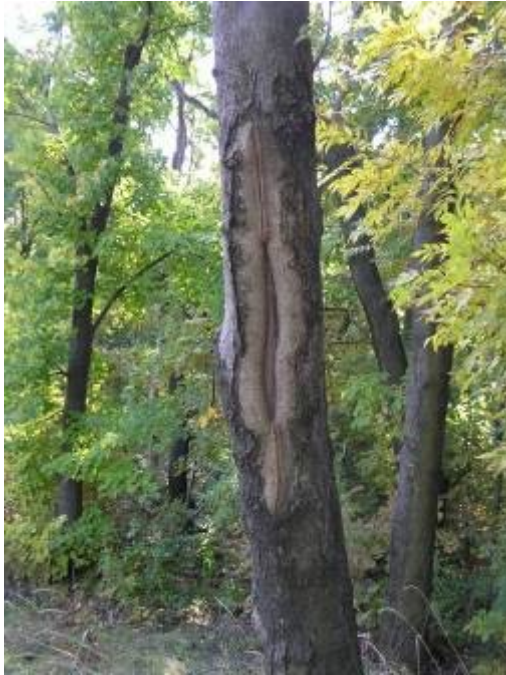
1.kép Nyúzási nyomok a szélső fákon 2.kép