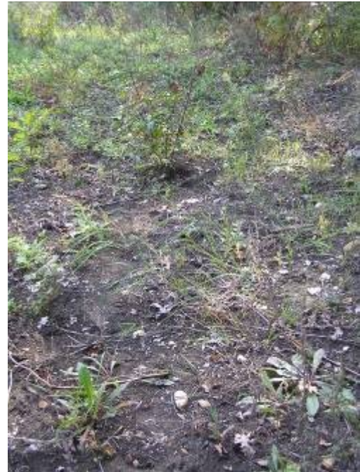
a telepített cserjék egy része kiszáradt